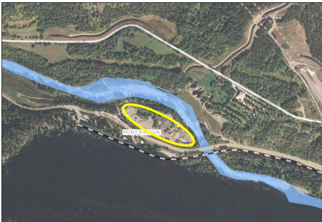
Figura 2.1 – Inquadramento dell'area su fotoaerea

Il Sito di lavorazione di inerti si trova nella parte di valle dell'area di proprietà di Pietra di Morgex Srl, occupando circa 6.500mq ubicati nel secondo terrazzo alluvionale della Dora Baltea a quota 960m slm; la parte di monte della proprietà di Pietra di Morgex Srl risulta occupata dal piazzale industriale utilizzato come deposito e lavorazione della pietra; la fascia lungo la Dora Baltea risulta invece arborata, in quanto è stata mantenuta la vegetazione spondale per una larghezza non inferiore a 11m (vedi Tavola 1 – Corografia).